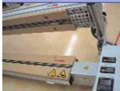
Élhevítők és élhajlítók